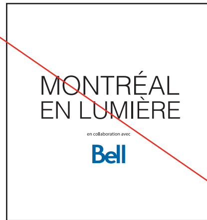
Changement de police de caractère.