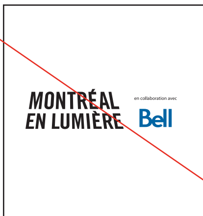
Séparation du logo et des commanditaires.