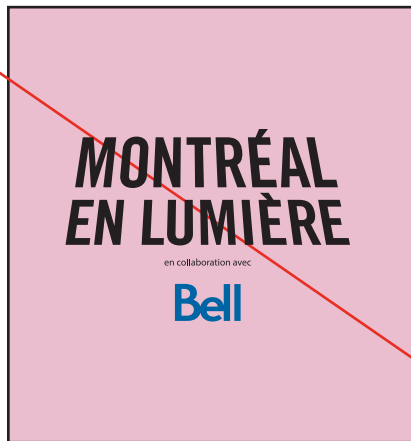
Le logo bleu du commanditaire sur un fond de couleurs.