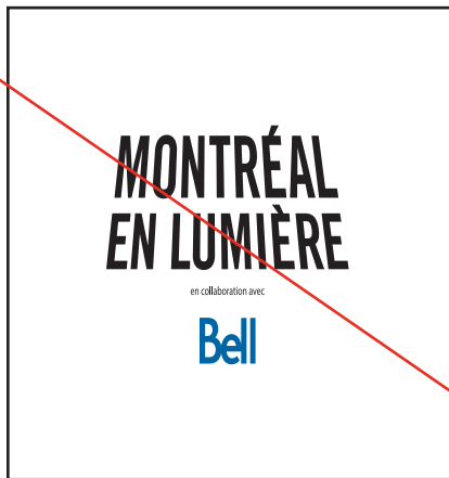
Déformation du logo.

Afin de préserver l'uniformité de l'utilisation du logo du Festival, il est important de ne pas le modifier. Voici quelques exemples à éviter.