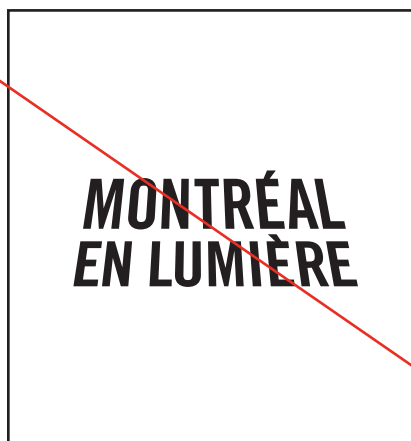
Utilisation sans les commanditaires.