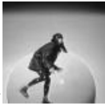
alliérite