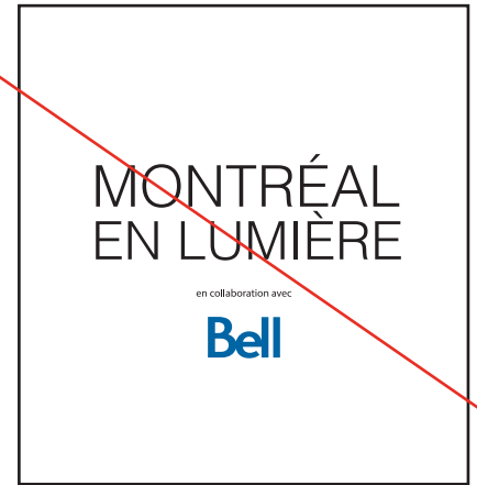
Changement de police de caractère.